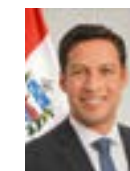
2º Vice-Presidente Rodrigo Cunha (União-AL)