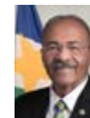
3º Secretário Chico Rodrigues (PSB-RR)