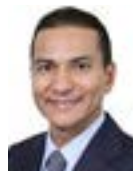
1º Vice-Presidente Marcos Pereira (Republicanos-SP)