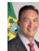
4º Secretário Styvenson Valetim (Podemos-RN)