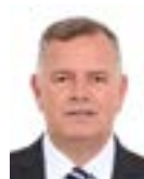
4º Secretário Lucio Mosquini (MDB-RO)