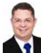
2º Vice-Presidente Sóstenes Cavalcante (PL-RJ)