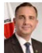
Presidente Rodrigo Pacheco