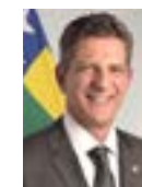
1º Secretário Rogério Carvalho (PT-SE)