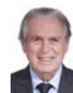
1º Secretário Luciano Bivar