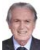
1º Secretário Luciano Bivar (UNIÃO-PE)