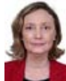
2º Secretária Maria do Rosário (PT-RS)