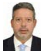
Presidente Arthur Lira (PP-AL)