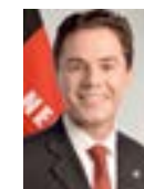
1º Vice-Presidente Veneziano Vital do Rego (MDB-PB)