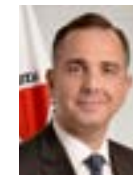
Presidente Rodrigo Pacheco (PSD-MG)